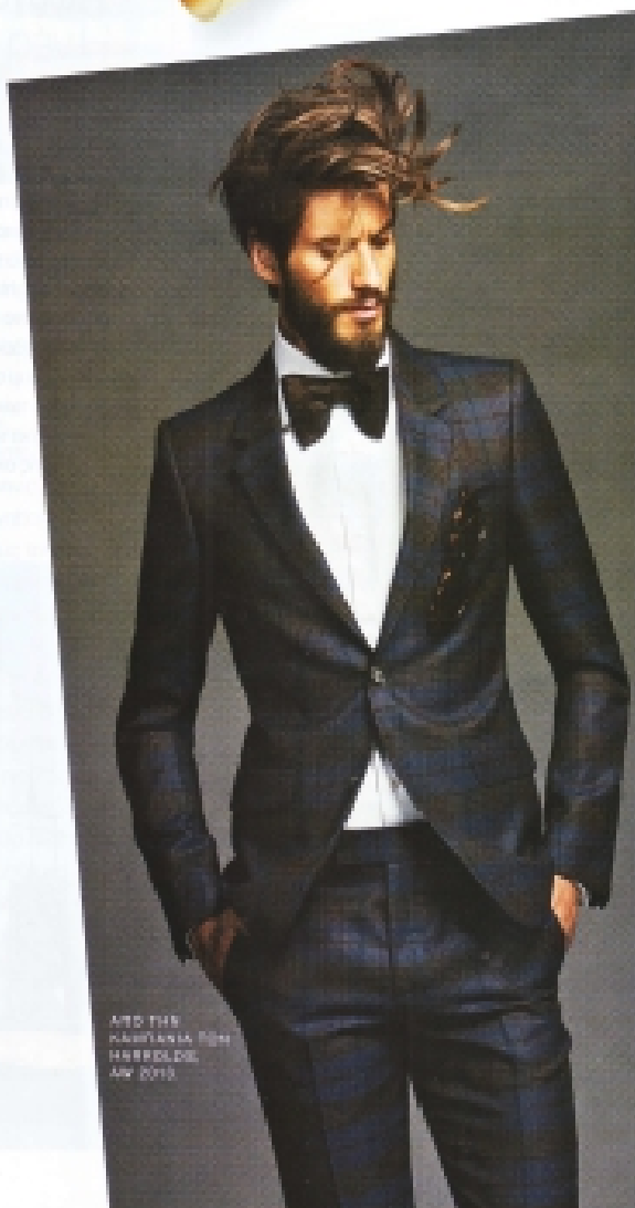
AND THE HARBINGER FOR HERMITAS, JAN 2012

Ο Γιώργος Καράβας έχει χαρακτηριστεί από το διεθνή media ως «αίθριος Έλληνας θεός». Η σκληρή γοητεία και το διαπεραστικό βλέμμα του τον κάνουν να ξεχωρίζει στον χώρο του ανδρικού μόντελιנג παγκοσμίως, εστιάζοντας του, παράλληλα, συνεργασίες με κορυφαία ονόματα, όπως των Giorgio Armani, Gianfranco Ferré και Trussardi. Το κομμάτι που μας πήρανε υπέδειξε ως κεντρικό πρόσωπο του σίκου Hermitas και φωτογραφήθηκε για τις ανάγκες της παγκόσμιας εκστρατείας του, καθώς και του εταρικού περιοδικού «Le Monde Hermitas», το οποίο εκκωφαντικά έθεσε στό μπινα στο κοσμηματο του οίκου.